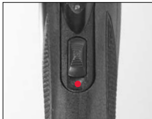
La « sûreté » montrée en position « non sécuritaire ».