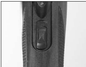
La « sûreté » montrée en position « sécuritaire ».